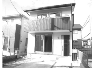
南向き・外構工事付・オール電化

土地 99.04㎡(29.96坪) 2F) 7.5洋・6.7洋・6洋 1F) 16.7LDK 完成済 船岡団地バス停歩3分