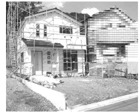
南向き・駐車2~3台可

土地 139.65㎡(42.24坪) 2F) 6洋・6洋・6洋 1F) 4.5和・16.5LDK 平成22年12月完成予定 一宮東門バス停歩5分