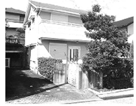
南向き・お庭有り・駐車2台可

土地 183.19㎡(55.41坪) 2F) 8洋・7洋・7洋・4納 1F) 6和・15LDK 平成8年9月築 旭グリーンヒルズ入口バス停歩8分