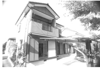
駐車2台可・角地で日当良好

土地 173.46㎡(52.46坪) 2F) 6和・10洋 1F) 8和・6和・14LDK 平成6年5月築 潮見台バスターミナル歩1分