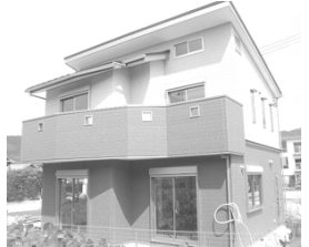
角地・駐車2台可・オール電化

土地 102.27㎡(30.93坪) 2F) 6洋・6洋・6洋・3納 1F) 6和・14LDK 完成済 JR一宮駅歩5分