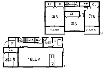
駐車3台可・オール電化

土地 152.10㎡(46.01坪) 2F) 8洋・6洋・6洋 1F) 4.5和・16LDK 平成23年1月完成予定 福井分岐バス停歩2分