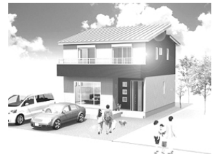
南向き・オール電化・エコポイント対象

土地 173.86㎡(52.59坪) 2F) 8洋・6洋・6洋 1F) 20.4LDK 平成23年1月完成予定 長崎北バス停歩4分